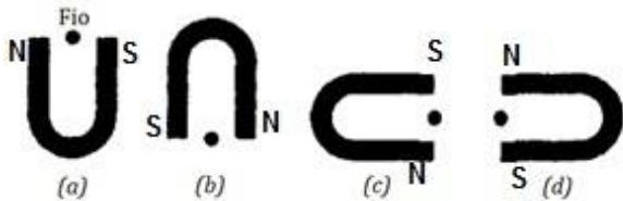
Fig. 30-35 Exercício 43.

43E. A Fig. 30-35 mostra quatro posições de um ímã e um fio retilíneo pelo qual elétrons estão fluindo para fora da página, perpendicular ao plano do ímã. Em que caso a força sobre o fio aponta para o topo da página?