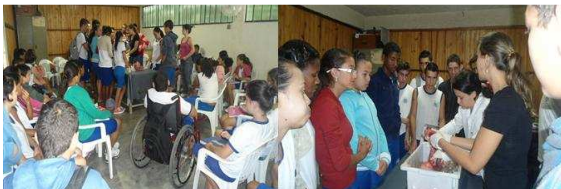
FIGURA 1: aula prática no laboratório de ciências

A observação direta foi empregada nas aulas formais ministradas pelos respectivos professores, bem como nas aulas práticas ministradas pelos estagiários (FIGURA 1).